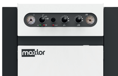
Puesta en marcha incluida (consultar desplazamientos)